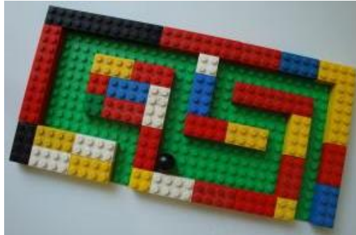
Labirint iz lego kock.

Kocke so odlična igrača. Nešteto načinov igre omogoča zabavo in obenem razvoj. Ena od teh je, labirint, kot je prikazano spodaj na sliki. Potrebujete podlago, kocke in frnikolo, žogico, kaj kar se kotali in imate to doma.