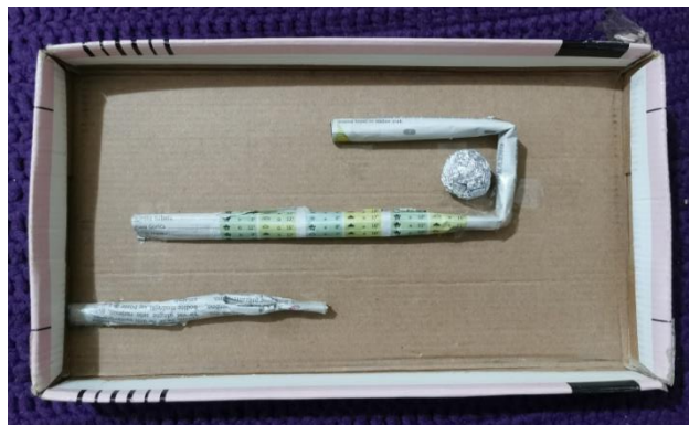
Preprost labirint (Dragana J.)

Če doma nimate lego/duplo kock, lahko naredite labirint iz odpadnega materiala. Na primer: Karton ali pokrov od škatle – za podlago, škatlice, časopisni papir, ki ga zvijete v kačo, odpadno embalažo – kot ograjo za labirint – na podlago jih prilepite z lepilom/selotejpom, dodate žogico/frnikolo/nekaj, kar se kotali – lahko naredite žogico iz alu folije in igrača je narejena. :)